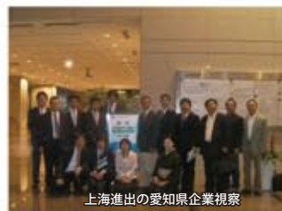
上海進出の愛知県企業視察