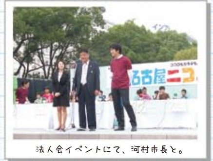
法人会イベントにて、河村市長と。