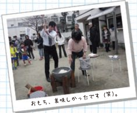
おもち、美味しかったです(笑)。