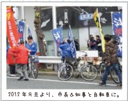
2012年元旦より、市長&知事と自転車に。