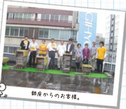
銀座からのお客様。