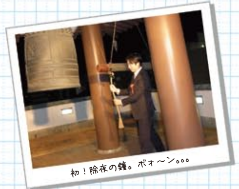
初！除夜の鐘。ポオ〜ン。。。