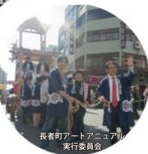
長者町アートビエンナーレ 実行委員会

愛知県では初開催となった【あいちトリエンナーレ2010】では愛知芸術文化センターや名古屋市美術館だけでなく、まちなか会場として長者町では多くの作品が展開されました。“まちの人”として多くの作品やアーティストに関わり現代アートとは全く縁のなかったタイプの僕でしたが、驚くほど楽しめました。また、期間終了後も長者町では“アートなまち”への新しいまちづくりの取り組みが始っています。