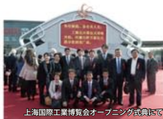
上海国際工業博覧会オープニング式典にて

中国で開催された【上海国際工業博覧会】開会式に来賓として参加！現地で活躍する企業の国際交流を開催目的とした博覧会です。愛知県からも16社が出店。その後、日本企業の会社にも直接お邪魔してリアルな現場の話をいろいろと勉強させて頂きました。中国の環境への取り組みや農業展開等も視察。