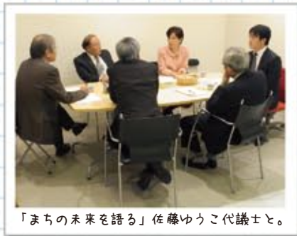
「まちの未来を語る」佐藤ゆうこ代議士と。