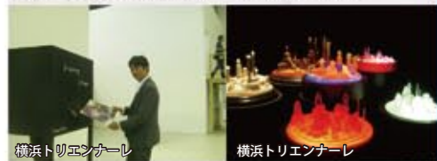
横浜トリエンナーレ