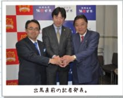
出馬直前の記者発表。

長者町アートアニュアル実行委員会 会長 錦2丁目まちづくり連絡協議会 顧問 第11回あびす祭り実行委員会 実行委員長 愛知県議会議員 初当選 会派「減税日本一愛知」