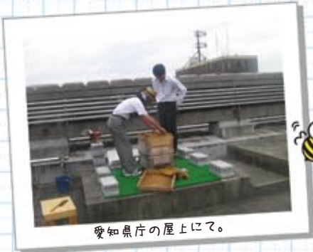
愛知県庁の屋上にて。