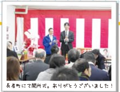
長者町にて開所式。ありがとうございました！