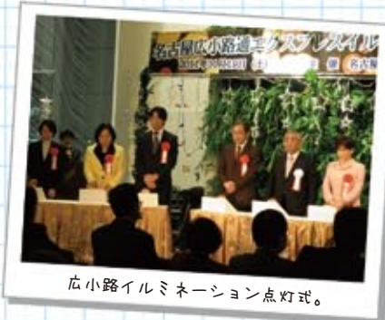
広小路イルミネーション点灯式。