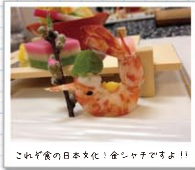
これぞ食の日本文化! 金シャチですよ!!