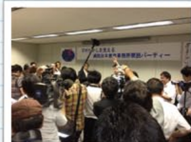
減税日本 東京事務所オープン!