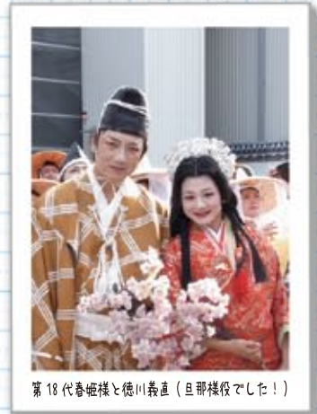
第18代春姫様と徳川義直（旦那様役でした!）