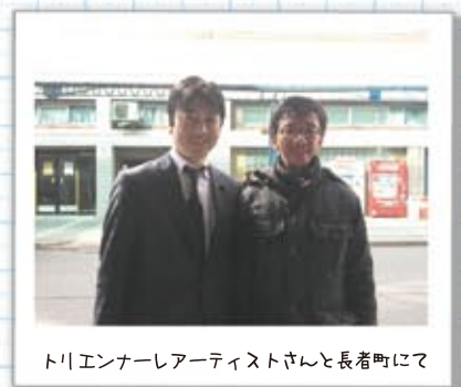
トリエンナーレアーティストさんと長者町にて