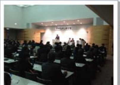
河村たかし政治塾実行委員長就任