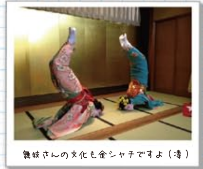
舞妓さんの文化も金シャチですよ (津)