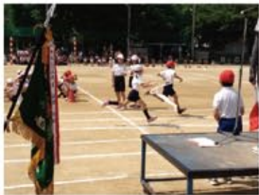
春の運動会にも参加!