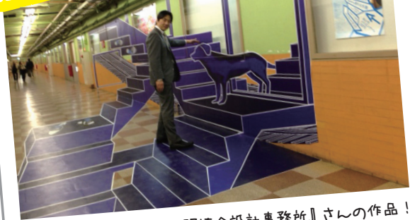
台湾から来日した『打開連合設計事務所』さんの作品!