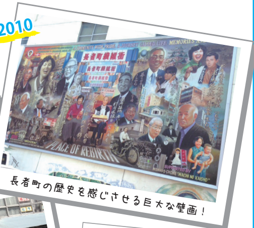
長者町の歴史を感じさせる巨大な壁画!